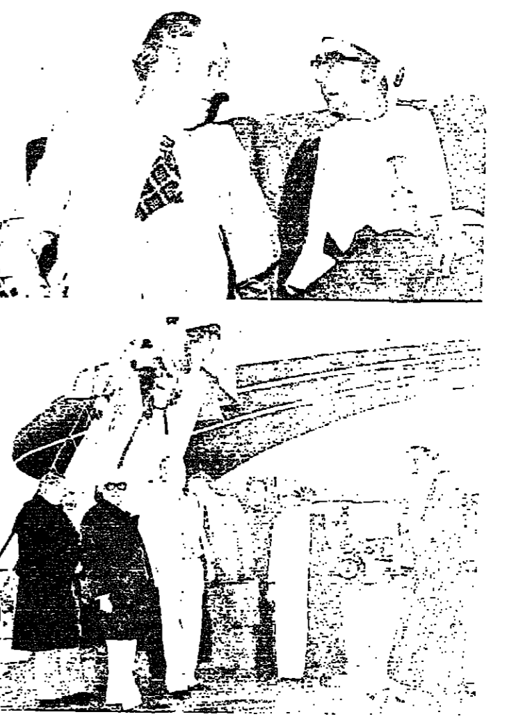
الوفد البرلماني الاتيالي الغربي لدى وصوله الى مطار السبيل يوم السبت الماضي وفي استقباله مدير الدائرة السياسية الثالثة بوزارة الخارجية وعدد من موظفي الوزارة .

قام معالي الشيخ الوليد بن زاهر الهنائي وزير الاوقاف والشؤون الاسلامية صباح امس الاول بزيارة تفقدية لمسجد قابوس والمكتبة الاسلامية الكبرى للاطلاع على سير العمل فيها . وقد ابدي معاليه ملاحظاته واعطى تعليمات للقائمين على انجاز هذين المشروعين اللذين جاءت هذه الزيارة في نطاق الجولات التفقدية التي يقوم بها معاليه بين الحسين والآخر لمشروعات الوزارة للاطمئنان على سير العمل فيها . وقد رافق معالي وزير الاوقاف والشؤون الاسلامية في هذه الزيارة سعادة الاستاذ علي ابراهيم مدير عام الوزارة .